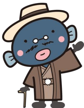
手賀沼のうなぎちゃん ©我孫子市 2012

我孫子市では子育てと就労の両立を支援するために、病気回復期には至らないが当面症状の急変は認められないお子さん（病児）、または病気回復期にあるお子さん（病後児）を、医療機関内にある病児・病後児保育室で一時的にお預かりする、デイサービス事業を実施しています。