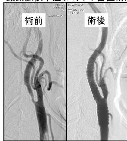
頸動脈狭窄症(ステント留置術)

病気というものはさまざまですが、予め分かっていたら重篤な発病を防げるのではないかと考えます。心配なことなどありましたら、人間ドックや脳神経外科への受診をお勧めいたします。私たち病院スタッフがお待ちしております。