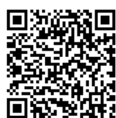
名戸ヶ谷あびこ病院